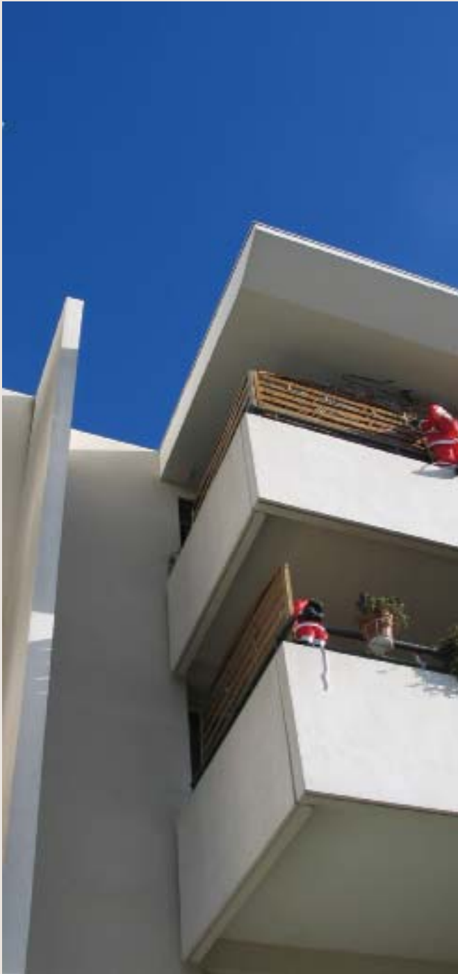
Au total, 265 logements seront construits sur la ZAC de la Source du pré