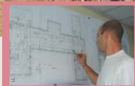
Une fois qualifié, le Carré Saint-Jacques abritera 75 nouveaux logements