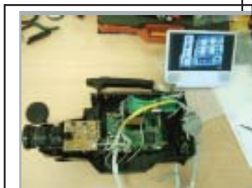
Renseignements et démonstration sur http://scp.camera.free.fr