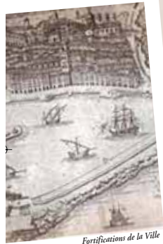
Fortifications de la Ville