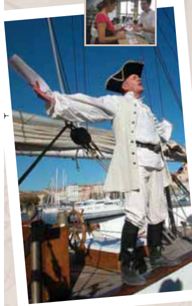
Capitaine BABOON J'y suis, j'y reste, pour que nulle peste ne revienne!