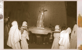
Documents réalisés d'après les sources : les Archives communales, les Archives du Musée de La Ciotat - Patrick Mouton, La Malédiction du Grand Saint-Antoine 2001