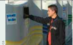
Tri sélectif, le bon réflexe