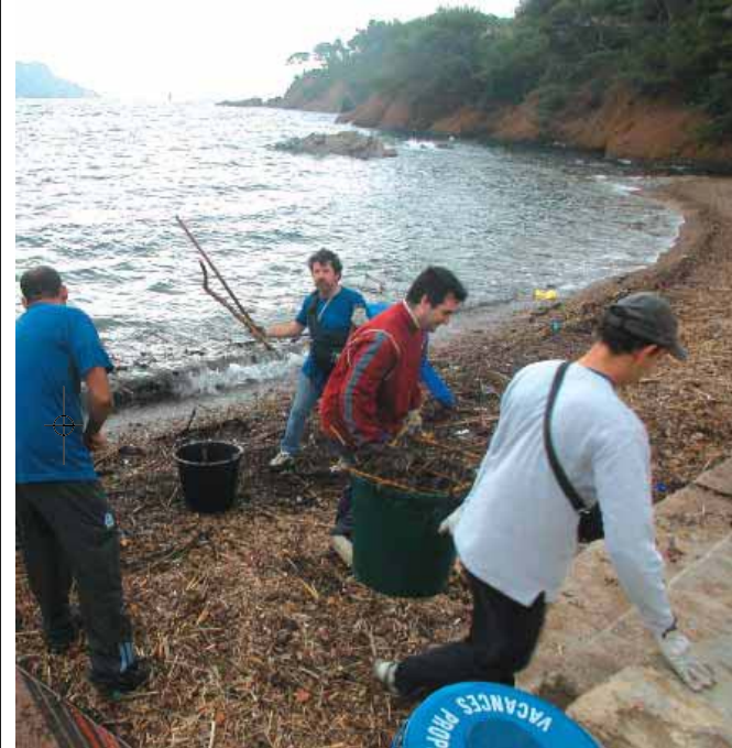
La propreté et l'entretien du front de mer sont une priorité constante de la municipalité