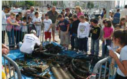
Des actions de nettoyage du Port-vieux ont lieu chaque année afin de sensibiliser le plus grand nombre

d'entretien concernant l'élagage, le désherbage ou encore la tonte, a été signé l'an dernier, à hauteur de 230 000 euros par an sur trois ans».