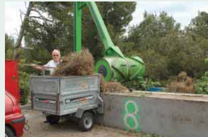
La déchetterie communautaire est gratuite pour les particuliers et les professionnels