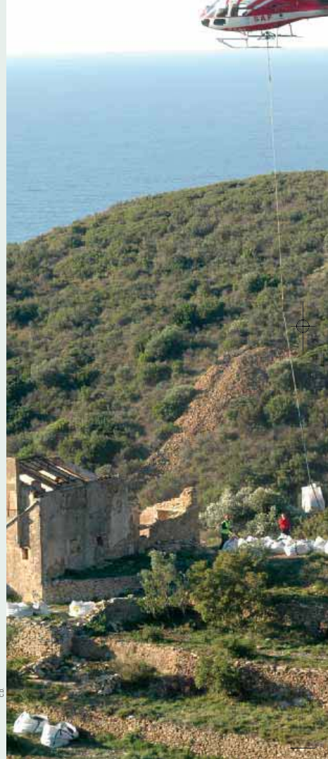
Opération hélicoptère de nettoyage du domaine de Sainte-Frétoise en novembre dernier

Une autre opération d'envergure a été menée voilà quelques jours par la Ville, le Conservatoire du littoral et l'association «Les jardins de l'espérance» : un chantier d'insertion «environnement» organisé par l'association et le service Cadre de vie a poursuivi