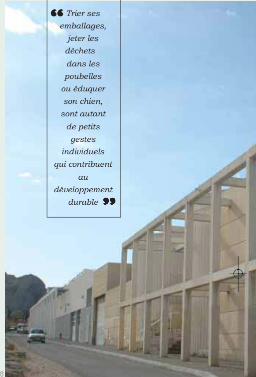
La nouvelle station d'épuration est désormais opérationnelle pour traiter biologiquement les eaux usées de 95 000 habitants

C'est aussi dans cette perspective qu'un vaste aménagement verra le jour sur le littoral, en 2007. S'inscrivant dans la continuité des aménagements précédents, la quatrième tranche du